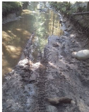
Passages de motos hors voie ouverte à la circulation publique

De plus, les manœuvres des véhicules peuvent être responsables de la dégradation des habitats et de la flore (blessures aux racines, aux jeunes arbres) ainsi que de l'érosion et de la dégradation des sentiers.