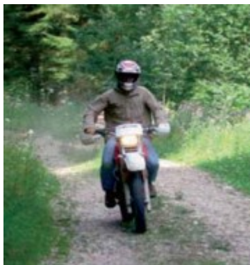
Circulation possible sur les chemins ruraux

La circulation des véhicules à moteur (quads, 4X4, motos, automobiles, etc.) et des engins de déplacement personnels motorisés (trottinettes, gyropodes, swincar, etc.) dans les espaces naturels peut porter gravement atteinte à la faune sauvage de notre département. Dès le printemps, période de renaissance et de reproduction pour de nombreuses espèces, l'intrusion de véhicules peut occasionner des nuisances sonores et du dérangement provoquant panique et fuite de certaines espèces en dehors de leur territoire et mettant en danger un équilibre écologique déjà fragilisé.