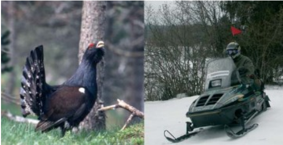
Certaines espèces, comme le Grand Tétrard sont très sensibles au dérangement

Les motoneiges utilisées à des fins de loisirs ne peuvent l'être que sur des terrains aménagés à cet effet (sauf véhicules mentionnés dans la partie « Que dit la réglementation ? »*).